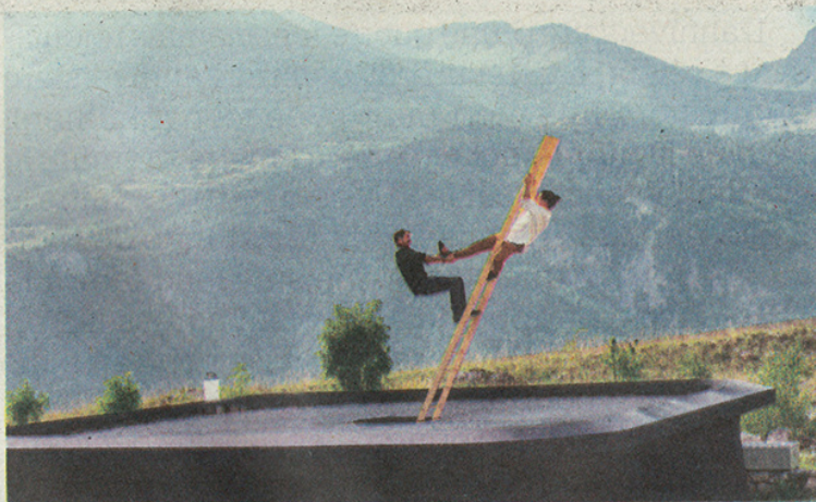
Le Poids des Nuages