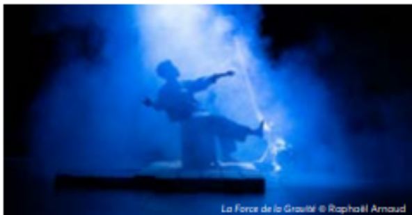
La Force de la Gravité

Le Cercle de Midi, membre du réseau national Le Chainon, propose un festival de spectacle vivant, Régions en scène, où public et professionnels viennent jouer dans la même cour. Les 13 et 14 février à Nice et Puget-Théniers.